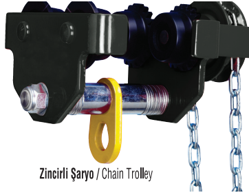
Zincirli Şaryo / Chain Trolley