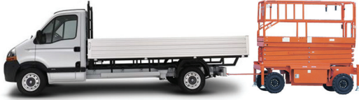
• Çekici yardımıyla platform nakli