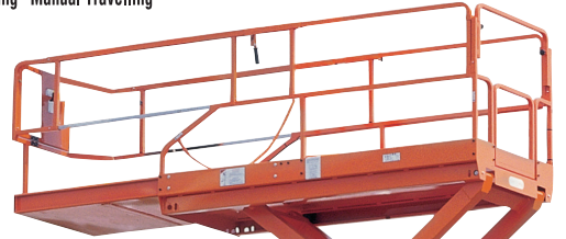
• Platform genişletme