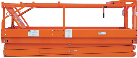
• Katlanabilir korkuluk sistemi