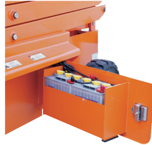
• Yandan açılır akü hazneleri