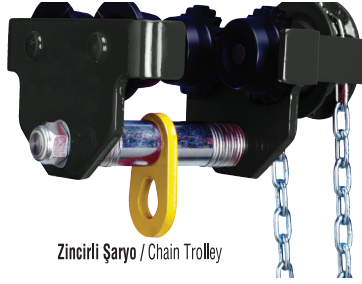
Zincirli Şaryo / Chain Trolley