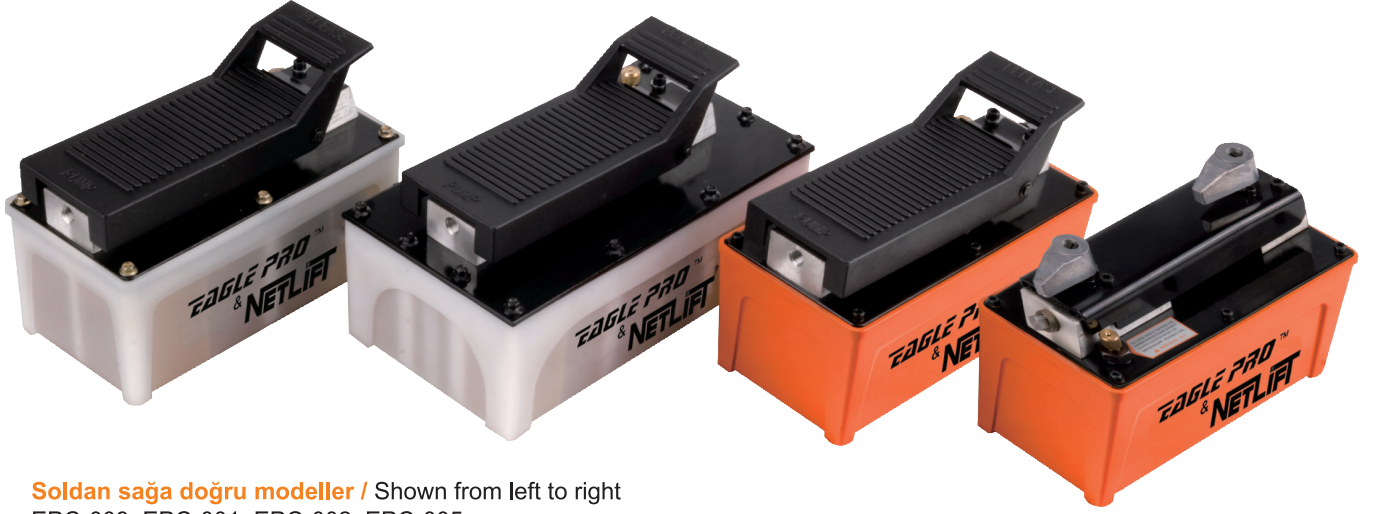
Soldan sağa doğru modeller / Shown from left to right EPC-009, EPC-001, EPC-002, EPC-005