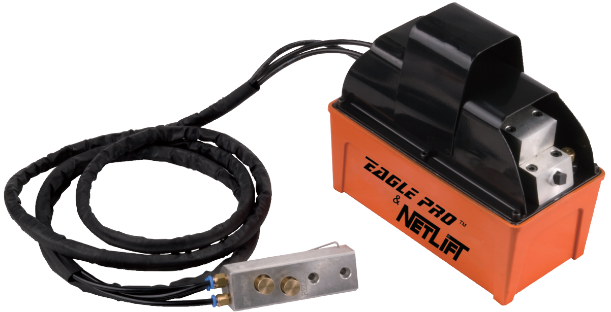
EPC - 008