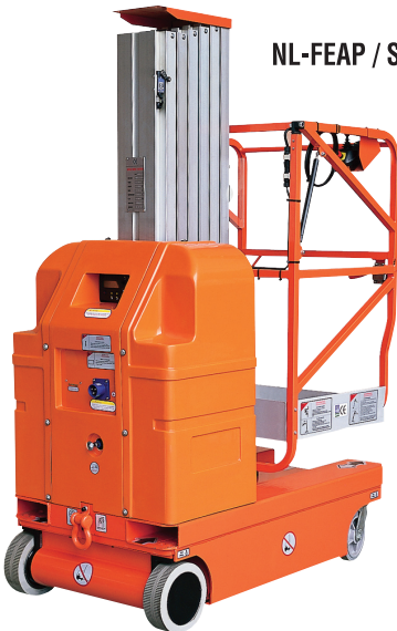
NL-FEAP / S