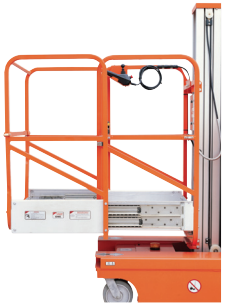
Opsiyonel / Optional: Genişletilmiş platform/ Extended platform