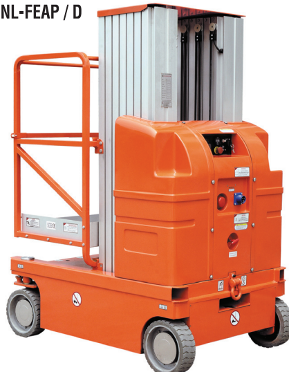
NL-FEAP/D 7.5 : 9.5 m NL-FEAP/D 9.0 : 11 m NL-FEAP/S 6.0 : 8 m NL-FEAP/S 7.5 : 9.5 m