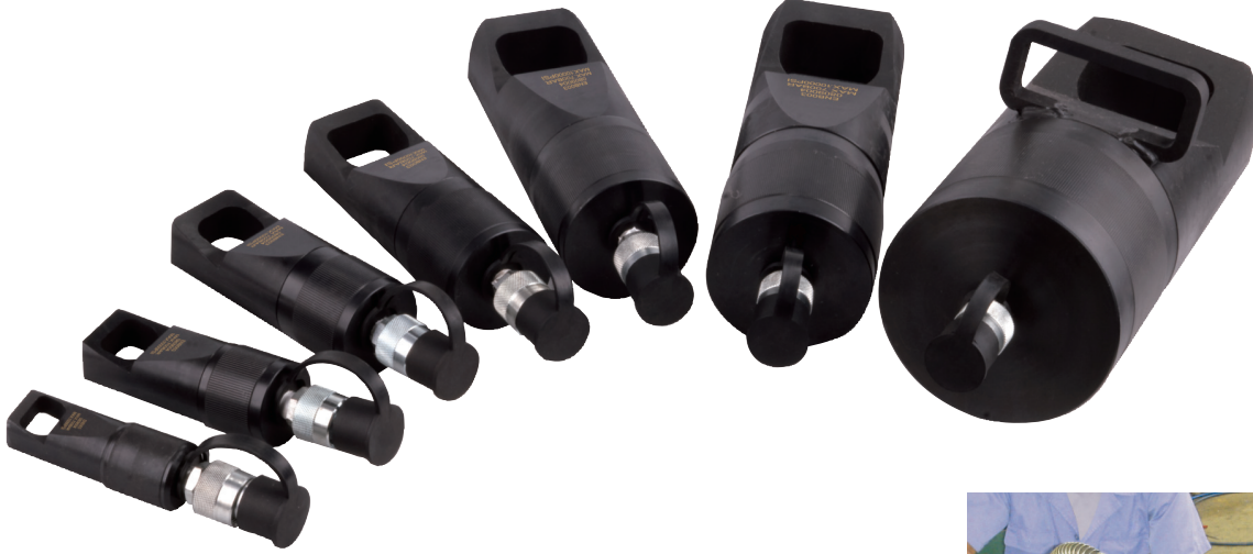
Soldan sağa doğru modeller / Shown from left to right ENS-001, ENS-002, ENS-003, ENS-004, ENS-005, ENS-006,ENS-007